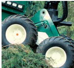
Den låga kraninfästningen ger maskinen en extremt låg tyngdpunkt. Då alla boggierna är låbara får du en suverän sidostabilitet, som låter dig köra kranen med full precision även i tuff terräng.