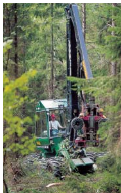
Med åtta hjul ökar bärigheten och markvänligheten. Det gör att svåra förhållanden plötsligt inte känns så svåra längre – och att du kan arbeta betydligt mer effektivt.

HPV är en maskin som alltid ger dig möjligheter. Genom att vara smidig nog för gallringsjobb och samtidigt kraftig nog för mindre slutavverkningar får du som förare en flexibilitet du kommer att uppskatta många år framöver.