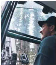
Den goda sikten i hytten gör att du kan följa äggragarens väg hela räckvidden. Och genom takfönstret kan du alltid se trädets krona – och välja ut rätt träd vid gallringen.

Du ser alla hjulen – och alla trädtopparna. När vi valde att montera hytten på boggien fick du inte bara en ovanligt god närsikt. Eftersom kranen sitter på samma ram får du en väsentligt bättre uppsikt på både kran och aggregat i gallring. Med hytten monterad på boggien åker du betydligt bekvämare i terrängen. Du märker snabbt att dina arbetspass blir effektivare, samtidigt som den goda kontrollen ger färre skador i beståndet.